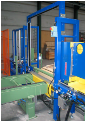
Machine tête latérale